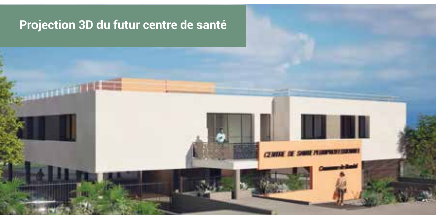
Projection 3D du futur centre de santé

En parallèle, le terrain de football en gazon synthétique aura franchi plusieurs étapes essentielles : drainage terminé, réseau d'arrosage installé, candélabres posés et sol préparé avec