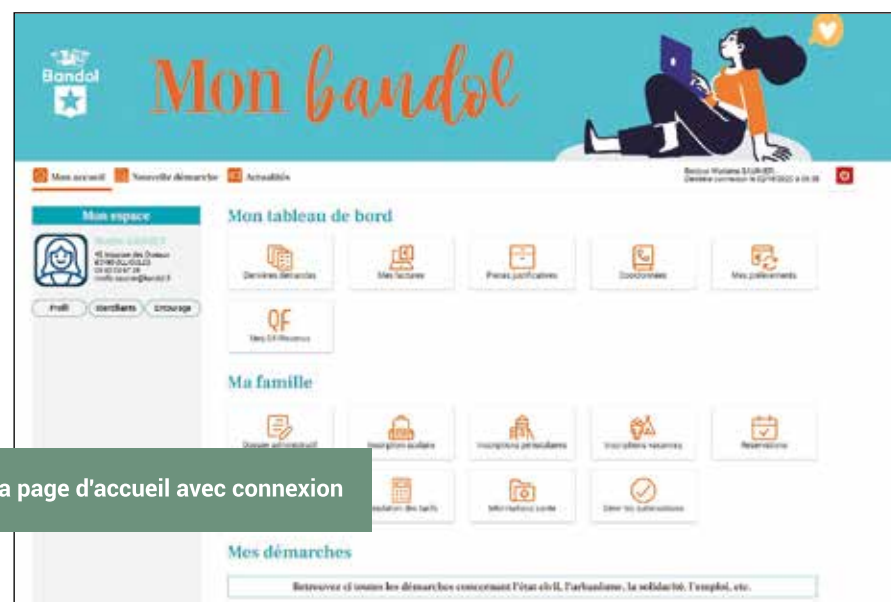
La page d'accueil avec connexion