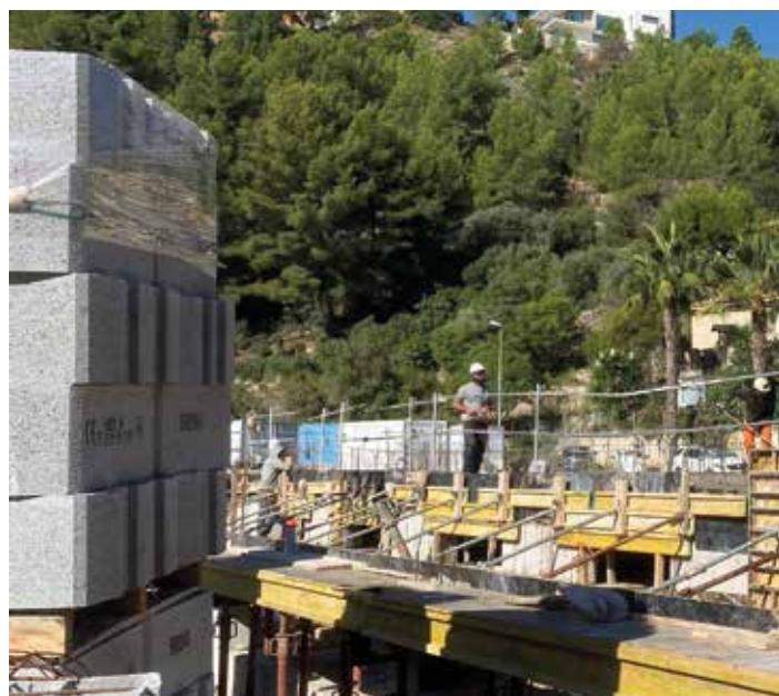
Apparition des fondations de la salle polyvalente du complexe

Les premiers éléments de la structure commencent à émerger : le noyau central, comprenant cage d'escalier et ascenseur, est en cours d'élévation.