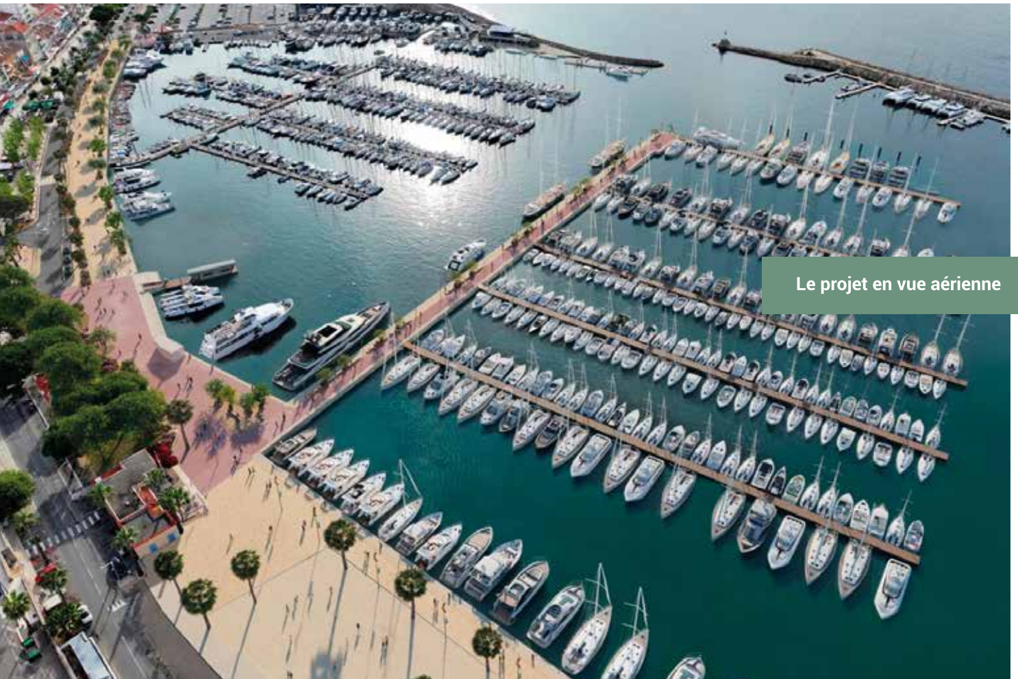
Le projet en vue aérienne