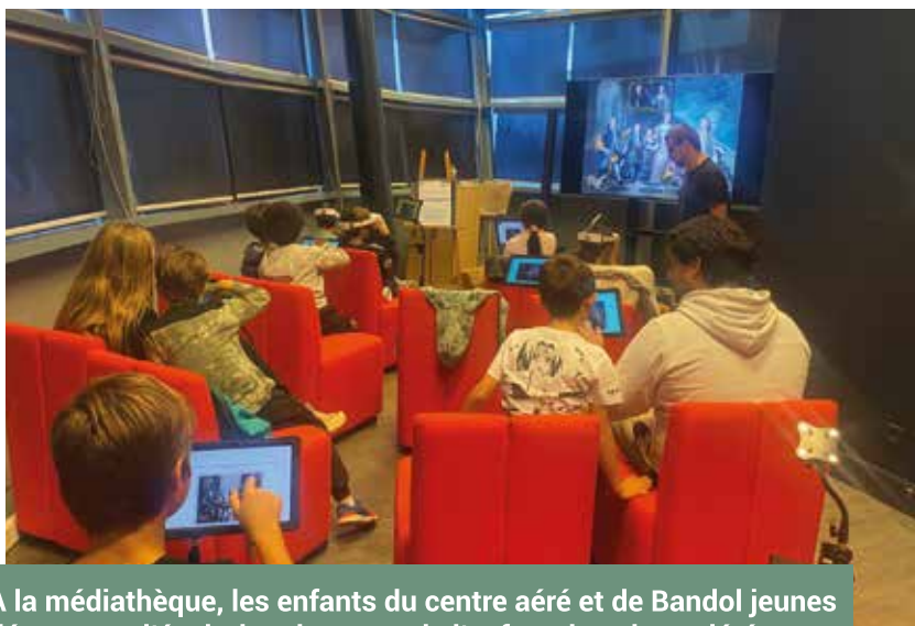
A la médiathèque, les enfants du centre aéré et de Bandol jeunes découvrent l'évolution du statut de l'enfant dans la société, depuis l'Antiquité jusqu'à la rédaction de la CIDE en 1989.

Enfin, pour marquer symboliquement cette mobilisation, l'Hôtel de Ville sera illuminé en bleu, couleur emblématique de l'UNICEF.