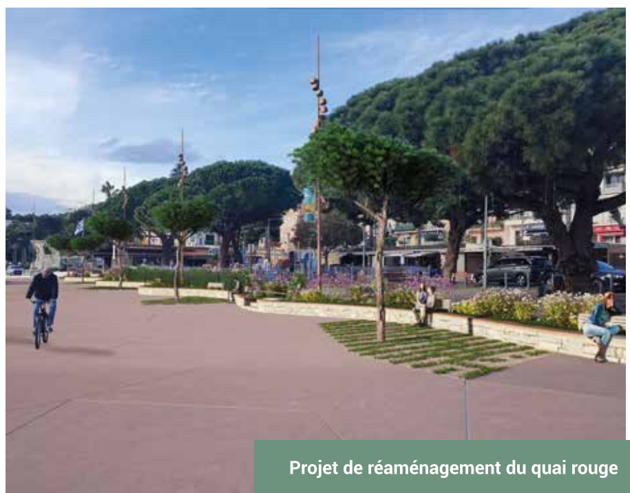
Projet de réaménagement du quai rouge

Elles sont visibles ainsi qu'une maquette du projet à l'accueil de l'Espace Paul Ricard (11 rue des Écoles).