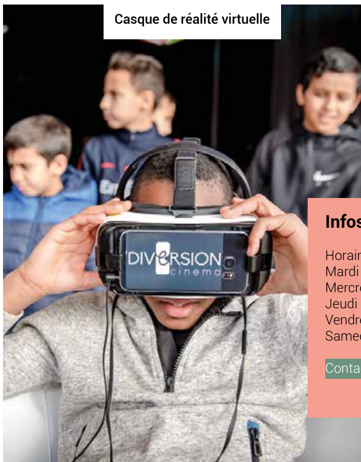
Casque de réalité virtuelle

Par ailleurs, un espace modulable central est consacré à l'action culturelle. Il pourra être utilisé pour présenter des expositions, pour organiser des conférences, des projections ou encore des rencontres-dédicaces. Enfin, un espace dédié au patrimoine historique de la commune est présenté autour de la sculpture originale de "l'Improvisateur".