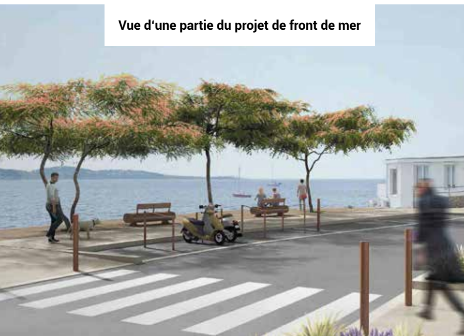
Vue d'une partie du projet de front de mer

suite à la réunion publique tenue le 16 septembre 2022. Une deuxième phase de travaux est programmée à la rentrée prochaine afin de continuer cette voie douce de la plage du Casino jusqu'à Sanary. Ces nouveaux aménagements permettront d'harmoniser les revêtements, les mobiliers et les éclairages actuels. Ils apporteront un meilleur confort et sécuriseront les piétons avec un élargissement des trottoirs et la création de bandes plantées gérant la séparation chaussée/voie verte. La promenade côté front de mer sera élargie et aménagée avec des espaces de repos ombragés. Enfin, ils faciliteront les usages en mobilité douce. Le square Bir hakeim sera également réaménagé afin de créer une ouverture visuelle vers la mer. Le choix des entreprises de travaux est en cours pour un démarrage des travaux du projet mi septembre 2023 et un objectif de livraison des aménagements fin avril 2024.