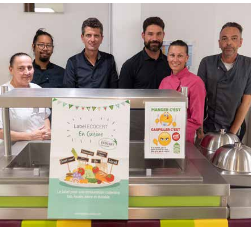
L'équipe de cuisine

Un maximum de produits frais et bio est proposé dans la composition des repas dans le respect de la saisonnalité. Alors que la loi EGalim impose 20% de produits biologiques dans les restaurations scolaires, à Bandol ce sont plus de 40% en moyenne de produits bio qui sont servis