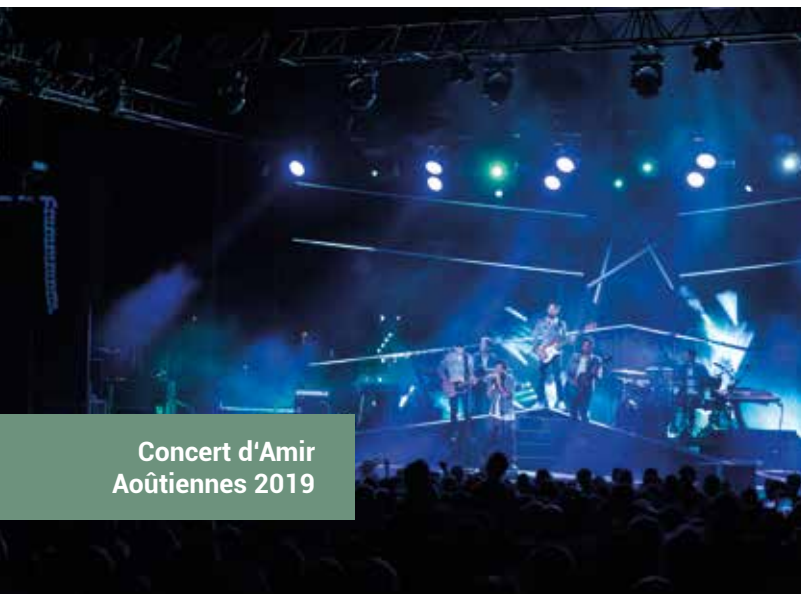
Concert d'Amir Aoûtiennes 2019

D'abord, le 2 août avec le très élégant groupe phare du rock français, Feu! Chatterton qui revient avec un troisième album «Palais d'argile». Après deux disques d'or et deux nominations aux Victoires de la musique, le groupe a parfait sa réputation en électrisant les foules aux quatre coins de la France. Le 3, une soirée off nous est offerte avec le groupe Carré Blanc qui revisitera avec brio les standards des années 80. Le 4 août, c'est le grand retour des véritables Gipsy Kings avec Tonino Baliardo, une soirée animée en perspective ! Pour finir, le vendredi 5 août, nous assisterons au concert tant attendu de Michael Jones mêlant ses titres, ceux de Jean-Jacques Goldman et du trio «Fredericks, Goldman, Jones».