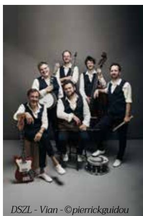
DSZL - Vian

générosité, c'est Cali qui présentera exceptionnellement à Bandol, son nouveau spectacle le 3 avril, suite à une résidence de création au Centre culturel Tisot à La Seyne-sur-mer.