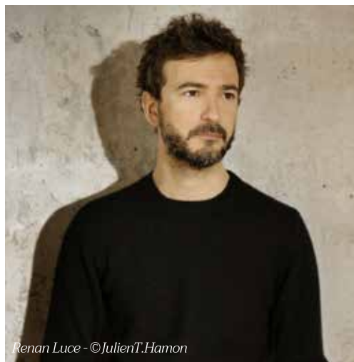
Renan Luce

Nouveauté de cette rentrée, la commune souhaite renforcer les actions d'éducation artistique et culturelle et développer une programmation dédiée au jeune public.