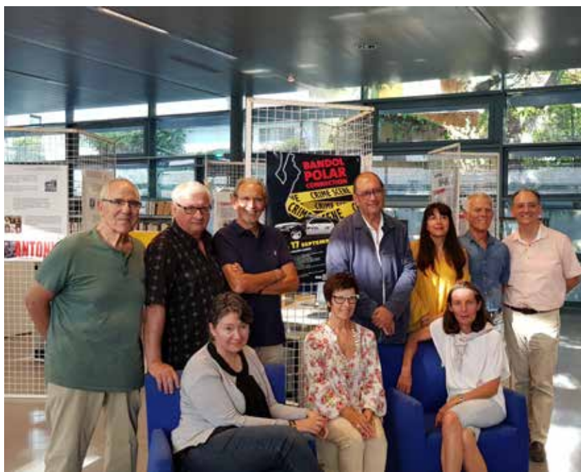
L'équipe de la médiathèque et les auteurs du CAB réunis pour le Salon du Polar

adulte handicapé Bénéficiaires du RSA munis d'un justificatif.