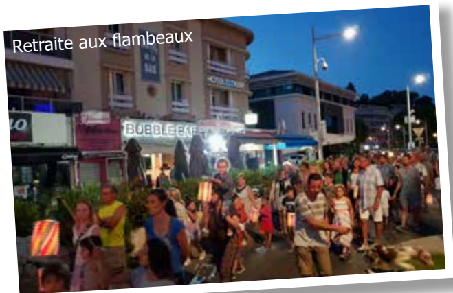
Retraite aux flambeaux