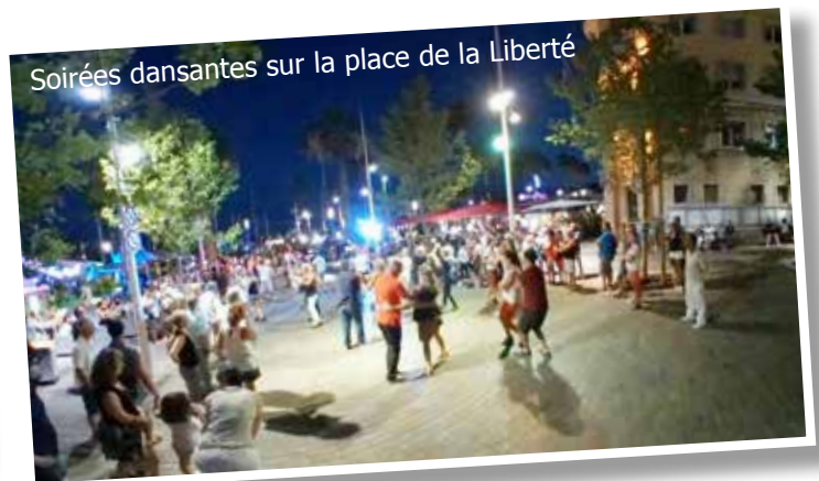
Soirées dansantes sur la place de la Liberté