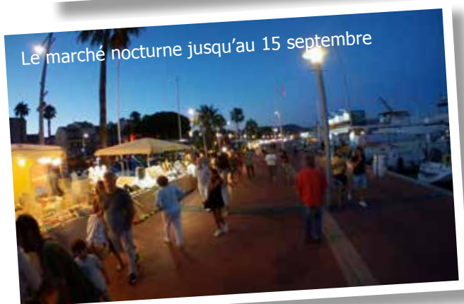
Le marché nocturne jusqu'au 15 septembre