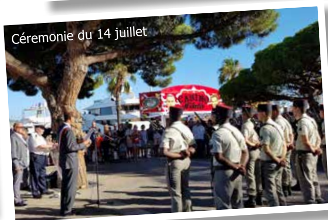
Cérémonie du 14 juillet