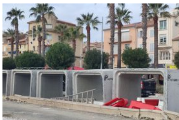
/ TRAVAUX INFORMATIONS AUX ADMINISTRÉS /